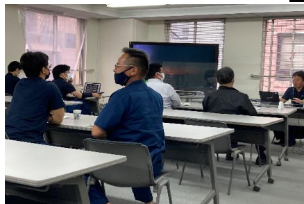
フルハーネス特別講習受講

UNマシンオペレーター4名と特販作業用品販売担当1名の計5名が、墜落制止器具「フルハーネス」の正しい使用方法を理解して安全性を向上させるための教育研修を受講しました。UNマシンオペレーターは基本現場下で作業を致しますが初回打合せ時等に屋上現場に上がることもありますので全員が特別講習を受講しハーネス対応に備えました。