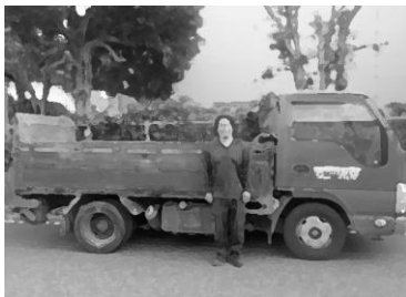
25万 千 。走行車継続使用