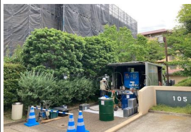
金沢区のマリンハイツ