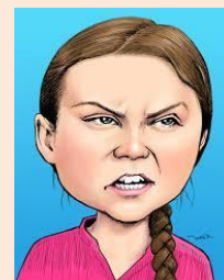
コロナも イブツコンニューもNoデス

2018年、中国が廃プラスチックのゴミを100%受け付けなくなり、国内での処理化プラス災害ゴミの処分最終処分場の値上げが続きました。処理量を超える廃棄物対応として、中間処分場の廃棄物受け入れ規制等もあり、また環境保護・循環型社会建設の為分別も厳しくなってきました。当社では、いち早く、産業廃棄物処理にプラス廃液処理のご提案をさせていただき、廃液処理キャンペーン等により現在、当初の倍の廃液処理をさせていただいています(謝)