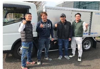
エネルギー関連施設(900㎡) (株)アールケイ様