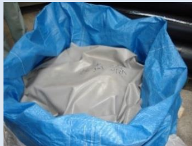
廃液をビニールまたはポリバケツ等で硬化させ、 廃プラゴミ として処理へ