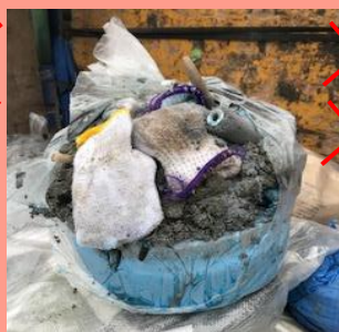
金属缶に異物混入のかたまり缶