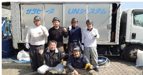
東久留米第二小学校(800㎡) (株)エイチピーツ様