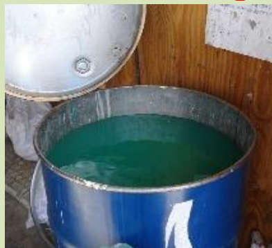
廃液処理のドラム缶(フタ下10cm)