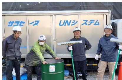
さがみ信用金庫成田事務センター(800㎡) (株)さがみ塗装工業様