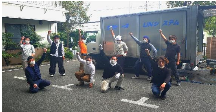
リゾン有明 670㎡: ナオキ(株)の皆さん