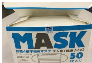
抗菌4層不織布マスク 箱サイズ183*112*95 やや大ぶり

旨いアジフライはなんと言っても、肉厚でふくらです この度特販チームでご用意させて頂いたマスクは 4層構造、3層目にメルトブロー不織布を使用し医療用 としての使用基準を満たし、箱を開けてもふくらとした オイシイ・マスクとなっています。(GEMARK取得ベトナム製) 5月緊急在庫致しましたが、直ぐに完売・・・その後 世間では中国製が値崩れし、普通?のアジフライが 多くなりました。旨いアジフライは仕込中でございます