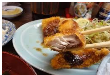
旨いアジフライ(肉厚)

旨いアジフライはなんと言っても、肉厚でふくらです この度特販チームでご用意させて頂いたマスクは 4層構造、3層目にメルトブロー不織布を使用し医療用 としての使用基準を満たし、箱を開けてもふくらとした オイシイ・マスクとなっています。(GEMARK取得ベトナム製) 5月緊急在庫致しましたが、直ぐに完売・・・その後 世間では中国製が値崩れし、普通?のアジフライが 多くなりました。旨いアジフライは仕込中でございます