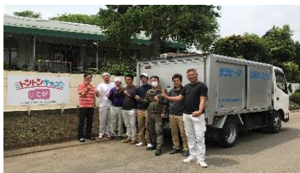
保育園トントンキッズ 800㎡ 明誠(株)の皆さん