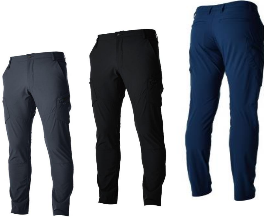
25チャコールグレー : 95ブラック : 45ネイビー