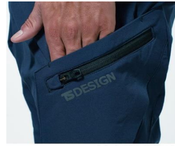
クイックアクセスポケット