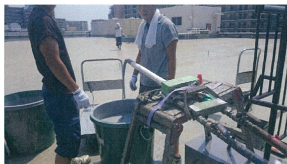
毎分10Lの攪拌済のウレタン吐出

8:30分にホースを上げ8:40分施工スタート 11時20分施工終了 11:30分ホースを下げ UN車12:30現場を出ました そう 午前中に施工終了できるようにご提案致させていただきます