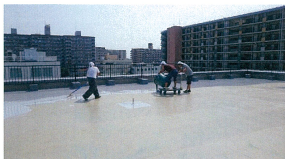
AM9:00 まだ幾分涼しい屋上です