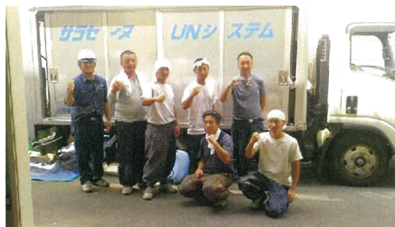
明日もバッチリ元気に働けるぜ~と施工を終え12時記念撮影 この後祭りに行けると気合充分な職人さん達