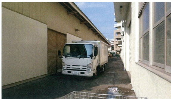
幸運にも2時間は日陰でのUN車設置できました

2015年猛暑 日本で2万人以上の方が熱中症にかかっているこの夏 UNチームは熱中症対策として 通常より1~2時間早い施工スタートを現場に御提案しています