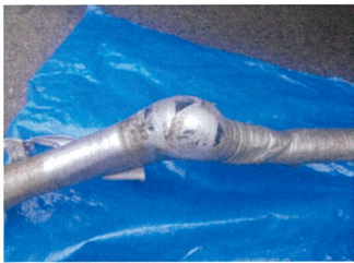
ホースの途中に膨れあり