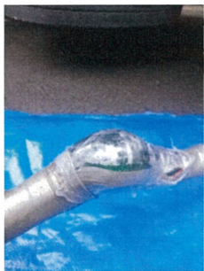
防食テープを剥すと ブレード入り耐圧ホースが内出血状態