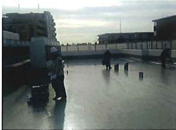
8:40キンキンに凍った屋上 霜のふき取り作業開始