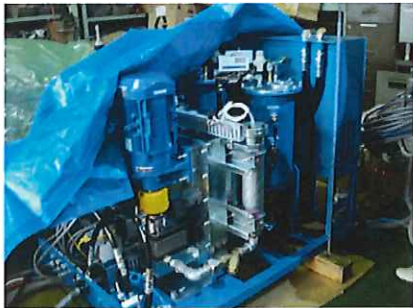
チョットだけよとベールを脱いだ5号機