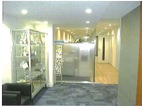
【アフター】 受付入り左側LED照明で明るくなり 応接通路からのベストポジションへ