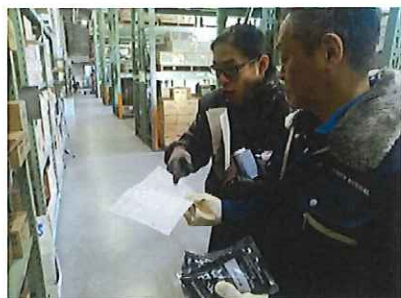
東京物流にて伝票の見方を知る