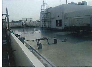
10:00ホースを上げUNネタ場完成