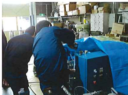
うおっコンパクトと叫びながらメジャで 採寸するOP

UNマシン5号機が完成しました 後は車両に搭載し 陸運局でナンバーを取得 技術研究所で最終チェックを終えたら 本格稼働に入ります。 はじめてその基幹部分の5号機を見た オペレーターからは「これはいい〜ッ」 との声上がり皆が5号機は俺の専属マシン にしたいと言い出しました 最新のタッチパネルは材料の流れが一目で わかる仕組みになっています 今オペレーターはじゃんけんを開始 「さいしょは 愚〜 俺達 パ〜」と