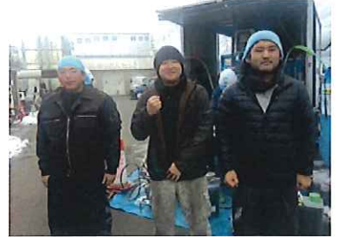
リピーターの職人さんと スゴイ午後からでも安心と・・・

2016年1月18日関東で雪が降りました。予定していたUN施工スケジュールが遅れる中、1/20荒川区の病院でUN施工スクールゾーン解除後の朝 8:30UN車設置した所、材料ネタ場は雪が残っていました、スコップで雪をかきUNマシンを暖気その頃屋上はキンキンに凍っていました。