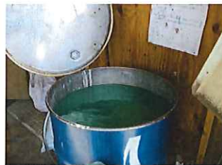
産廃処理は大変です 化研産廃チームに お任せください

恒例となりました 産廃処理キャンペーンを 2016年2~3月開催させていただきます キャンペーンを継続して4年が過ぎ未だに新規のお客様から 引合頂き誠にありがとうございます。