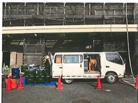
2トンバンタイプの楽マシン