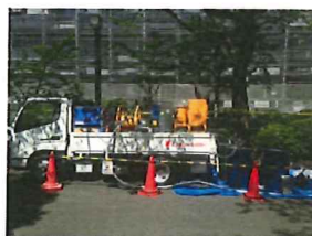
レンタカーに乗せ試験施工