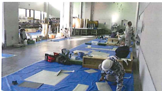
城東職業能力開発センター江戸川校

12/21・22日 ダイヤフォルテ防水工業会が主催した 今年の 塩ビの技能検定対策の事前講習会があり 関東では都合22名の受講者が参加されました 会場にはAGCの技術の方も見学にこられました 「あれ？どうしたの」と聞くと「塩ビの講習会はウレタンの講習会でも 非常に役に立ち、いい所をトータルで今後取り入れて行きたい」 との返事、そのお考えアツパレでございます。 全てのビジネスにおいて異業種・他社などの良い所を取り入れること は大前進につながります。架台の搬入・搬出は物流協力業者様 講習後の産廃に関しては産廃チームにトータルでご協力頂きました。