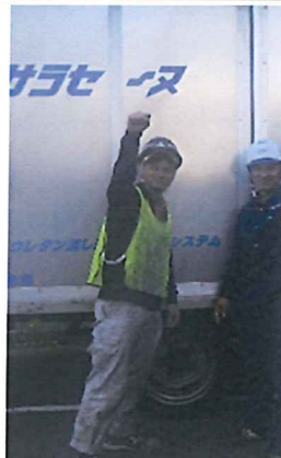
ホースの取り回しをティエム技建の若い職人さんと