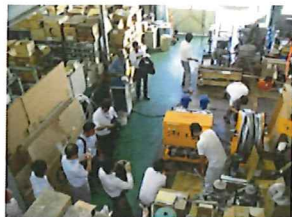
2016.8月組立途中を見学

コンパクトにするために従来タイプの油圧ユニットを無くす設計を立て、ポンプを新しいタイプに変更した。試行錯誤と思ひもよらない変更等、開発秘話が満載となった。そして2016年12月19日楽マシンで無事圧送をすることが出来た これからも兄弟(楽マシン)と力を合わせ現場の味方圧送システムの拡販に努めてまいります。