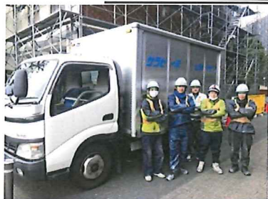
(有)ピーユーエム様