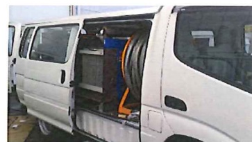
2トンバンタイプ車に搭載