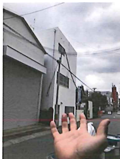
一層目 午後 小さな雪が...