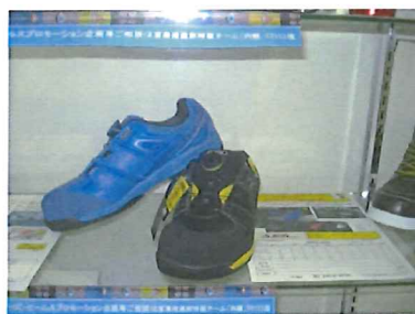
展示棚の安全靴イグニオ

【特販企画】の安全スニーカー「イグニオ」 当初仕入先様からチラシで100足以上目指したいとお話あり 40足受注を超えた後 銀の汗50号にもチラシ封入させて頂き 無事新記録の100足超えを達成することが出来ました。 これからも現場に役立つピカイチ商品をご提案させて頂きますので宜しくお願い致します。