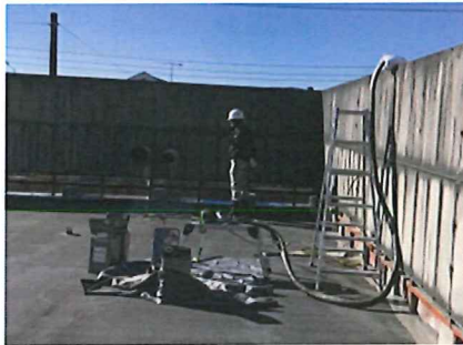
トリッキーなフェンス超えネタ場へ