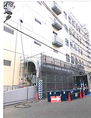
低層階へホース引き回し

大阪西区にある大阪東郵便局本田配送センター 1,700㎡をUN施工 2/5日:日曜日に東名高速からUN車を走らせ 6日の施工に備えたオペレーター 現場に着くと前日の雨で水掃きが必要また午後からの天気予報が雨の為翌日延期となり迎えた7日午後から怪しい雲が見えて来ましたが無事14:00に一層目施工終了。片付けしている途中で一瞬空から小さな雪が舞いました... その後の天気予報は寒気の影響で雪マークがある関西方面...8日 曇り予報にかけるしかなく。ほんの少しタックがきつい2層目でしたが施工中は太陽光が降り注ぎ 14:00に完璧な施工を終えることが出来ました