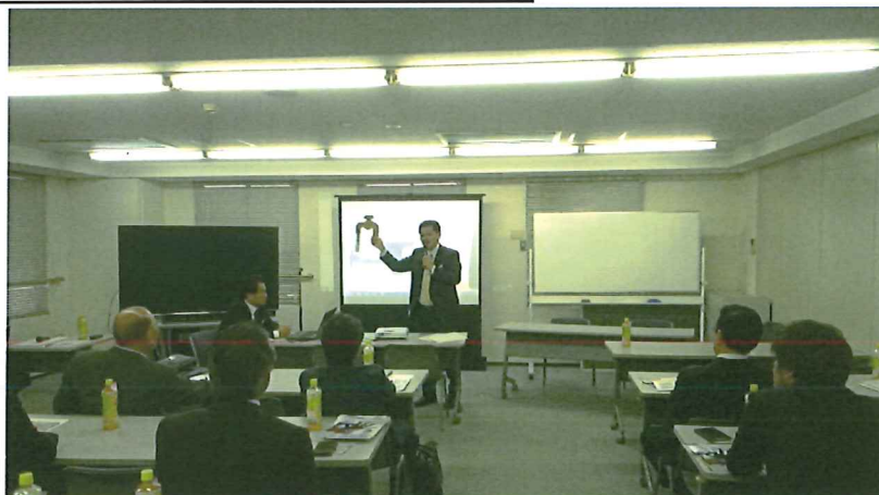
「UNは簡単に言うと施工現場に水道の蛇口を取り付けひねるとウレタンが出てくるのです」と説明

2/15日化研8F会議室にて総勢50名を越える関係者様を迎えての全ウレ東日本支部の研修会があり15:30からUNマシンレンタルシステムのご説明をさせて頂きました。実用新案?の水道パーツをお見せしたところ「オーっ」という、どよめきが会場を揺らし 皆様の脳に強烈に水道管がインプットされました。これから「水道管ください～」と受注があるかもしれません。