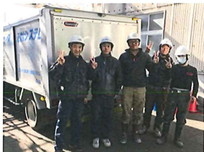
初めてのUN:カエデ建装の皆さん