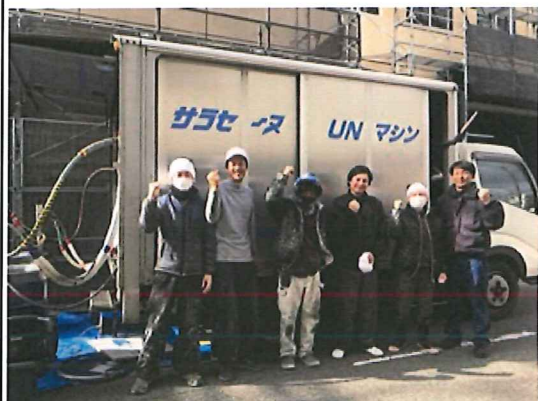
連続施工で無事終了 (株)関西シンセイの皆さん