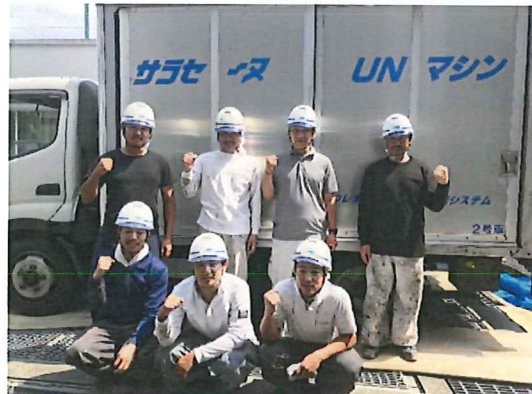
UN初使用の明和建工の皆さん