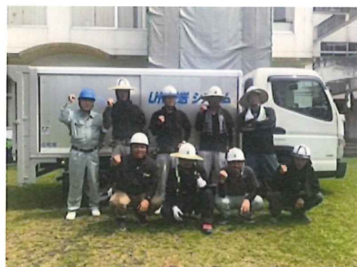
(株)AKUNEの皆さん UNはマンゴーのようにおいしかった