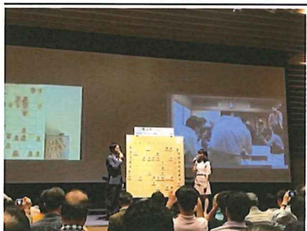
藤井四段30連勝ストップした場面

7月2日読売新聞社ホールにて藤井四段の30連勝が掛かった将棋の大盤解説会に参加、200名を超える人と会場両側にはマスコミがズラっと並んでいました。日曜6時のTV「バンキシャ」で現場中継があり、私が堂々と写り、友人より「今、写ってるよ」とメールが届きました。個人でも、全国に向かって進んでいます。投了