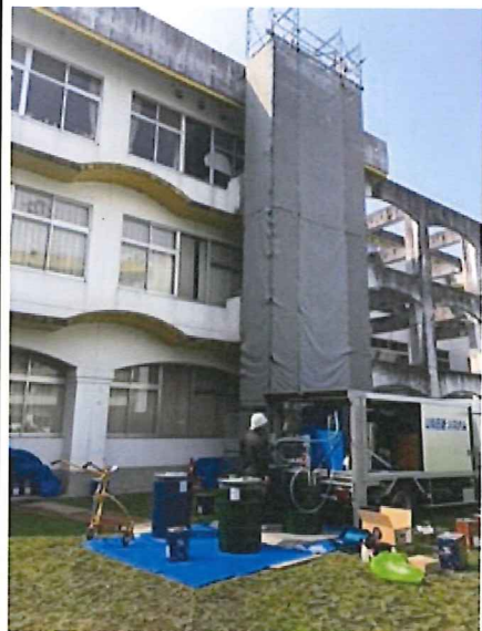
日章学園九州国際高校

現場からは「早くて助かりました」の声に、全国へ、この声を拡めて行きたいと・・・ 「どぎゃんとせんとイカン」と・・・ 石川OPはマンゴーをかじりました。