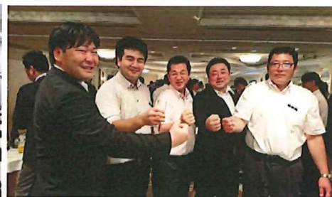
産廃・物流・元物流のヘビー級に囲まれた懇親会

48期方針発表会が6/24開催され、UNマシン曾根オペレーターが表彰されました。その後の懇親会において産廃、物流の0.1トンメンバーに囲まれて、暑苦しい思いをしました。