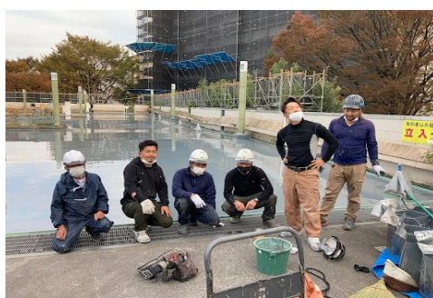
(株)スエヒロ工業・(株)グラニット様