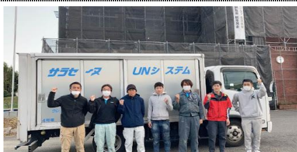
日本ウェルネス高校:太陽産業(株)様

西久保公園ハイツの数棟約3,000㎡をUNマシンで素早く施工しました。 15階建ての集合住宅、通常なら荷上げが困難な現場でしたがUNマシンならホースをホイストで上げるだけ 300～500㎡の屋上2～3か所ずつ施工、職人さんの負担も少なく終わる事ができました。(M)