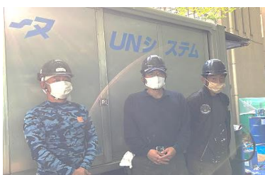
国立武蔵野学院:グラント様