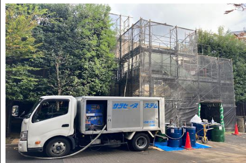
ひばりが丘パークヒルズ

リピーターのグラント様は段取りも良く850㎡を3名で素早く施工 1層目を終え、少し残った材料は翌日の2層目使用の為 「マクハリ」を行い(銀の汗Again25号参照)、2層目は1層目より早く 施工を終えることができました。また次の現場お待ちしております。(M)