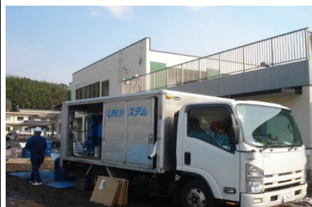
UNマシン4号機 初年度登録:2008年6月 19万キロ走行 担当OPも足腰経年劣化中