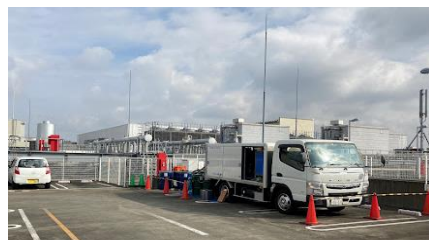
ノースポートモール:(株)ビーライフ様

生徒さんの邪魔にならない様短時間で施工終了「さすがUNです」とご満足 いただきました。次回の現場も宜しくお願いします(I)