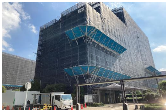
西久保公園ハイツ