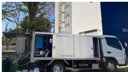
飛鳥建設:(株)新興社様

リピーターのグラント様は段取りも良く850㎡を3名で素早く施工 1層目を終え、少し残った材料は翌日の2層目使用の為 「マクハリ」を行い(銀の汗Again25号参照)、2層目は1層目より早く 施工を終えることができました。また次の現場お待ちしております。(M)