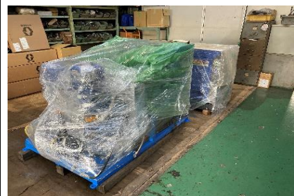
車装を待つUNマシン8号機

UNマシン8号機を作り始めて予定より納期が掛かっています。マシンは何とか完成したものの、積み込む4トン車そして車装して頂く所で大幅な納期変更へとなりました。世界的な半導体不足、また世界情勢の不安より益々先行きが不透明になっています。それでも7月には、現場の平和を守るUN8号機が完成予定です。