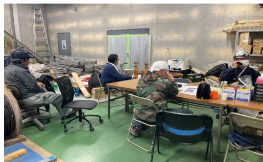
待機所でととのえ中のグラント様