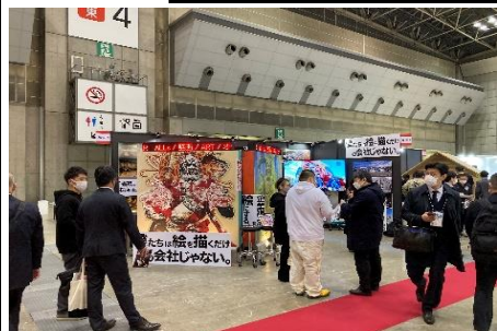
展示会とセミナー