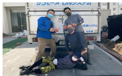
(株)スギヤマ防水様

何度もご利用いただいている、(株)スギヤマ防水様の現場でUNマシンを採用して頂きました。該当物件は昇降足場の設置場所が狭く「階段」ではなく「梯子」のタイプの足場が設置されていました。手塗りの場合、1層分30セットの材料を荷上げしなければなりません。体力、時間もそうですが、落下等の安全面も考慮してのUN採用でした。UNマシンに慣れたスギヤマ防水様、段取りもスムーズに行い午前11時には施工終了職人さんお体力も余裕がありバッチリ次の施工に備えられます。利用すればするほどメリットが出やすいUNマシンのご採用、お待ちしております。