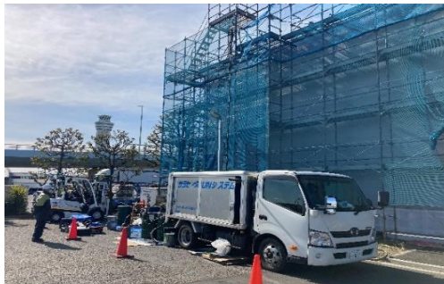
羽田貨物ターミナル特高変電所