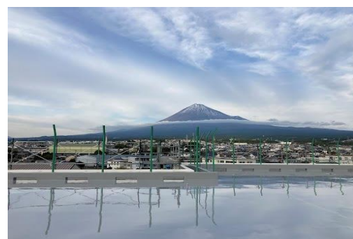
翌日富士山が見守る中無事UN施工