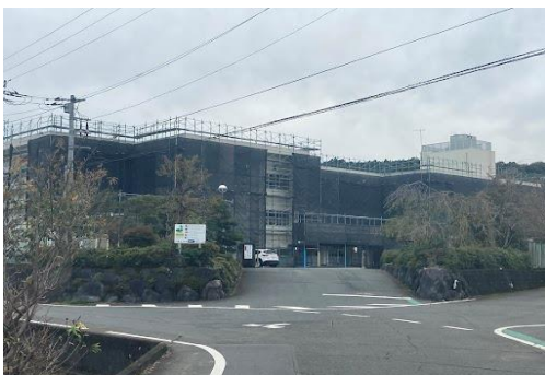
富士市の天間小学校