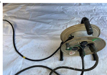
コードリールは全伸ばし

某工場敷地内のUN施工において、安全管理より、防災シートや消火器・バケツ設置 コードリールは漏電防止の為、全伸ばしでの対応をさせて頂きました。安全管理は基本の基本、無事故であらゆる現場に対応させて頂きます。