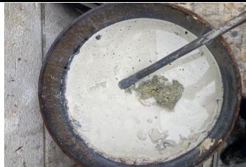
一部塊もある廃液