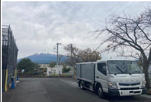
山頂が白くなったばかりの富士山をバックに前日打合