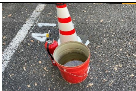
消火器とバケツ設置