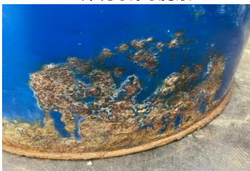
下部さびが酷い状況