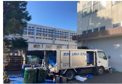
三笠書房流通センター1,300㎡