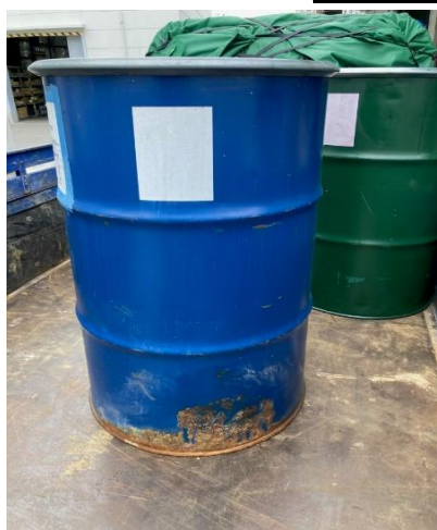
車輦に詰め込んだドラム缶