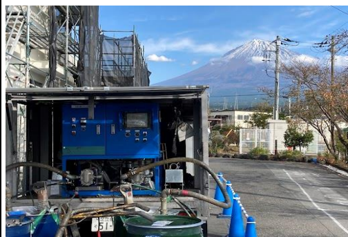
こんなにも雄大な富士の近くでUN