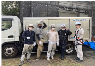
(株)ブルーテック様