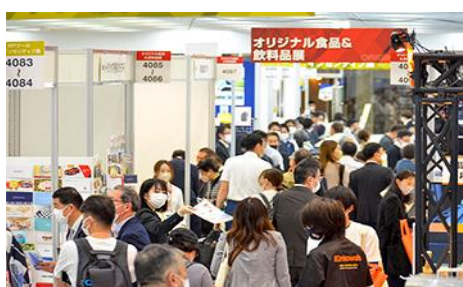
第67回プレミアムインセンティブショー