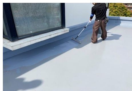
レーキでらくらく施工