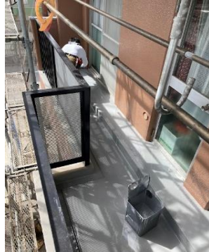
少し狭いベランダ部