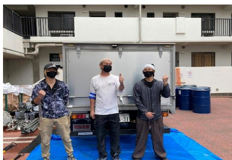
(有)中村防水工業様