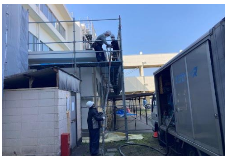
勝田第二中学校(ひたちなか市)1,000㎡

3月年度末決算、好調に進んでいるUN施工は、更に勢いを増す様に進めていますが、こちらがやる気マンマンでも、天気が雨なら施工は中止となります。 東京は年間約100日雨が降るそうです。(気象庁資料より) 365日-100日=265日 祝日、施工不可日などを考慮すると年間200日が勝負できる施工日と考えています。200日稼働目指します！