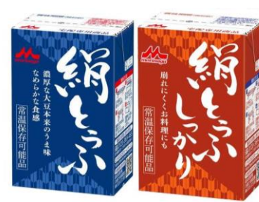
森永乳業ブースの豆腐

活気が戻った展示会は多くの来場者が来るようになりました。速乾性消臭のタオルの打合せを終えた後伺った、インセンティブショーでは、森永ブースで長期保存可の豆腐パックサンプルを頂き、牛乳配達のお客様先で「何か面白いもの」の声にお応えし企画したとの話を伺い、大変参考になりました。特販チームも「何かない?」の声にお応えできるようにアンテナ高く活動致します。