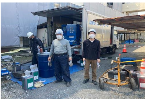
(株)ビューテンド様