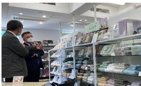
日織商工(株) タオルの展示会 (商談:特販宮崎)