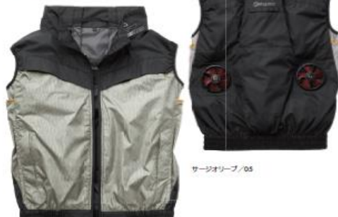
空調風神服チタンベスト

デザイン対応シリーズ The tough 空調風神服 チタン黒袖ブルゾン(6643) The tough 空調風神服 チタン半袖ブルゾン(6645)