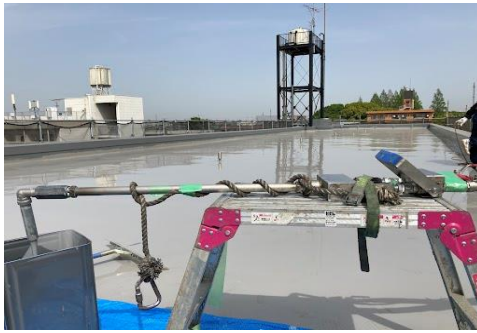
屋上にマシン先端部設置