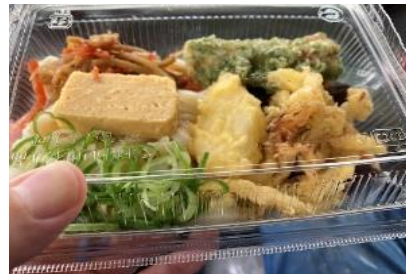
施工後の、うどん差し入れ ありがとうございました。