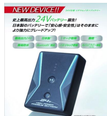
業界初24Vリチウム電池

特販イチオシの2品 チラシが完成! 、商品も在庫が整いました。今年も暑い夏が目の前にやってきました。作業が楽な、のびのびジョガーパンツと、業界初日本製24Vバッテリー仕様の空調ベストをお勧めします!!