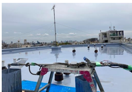
エステート前野町(板橋区)1,200㎡