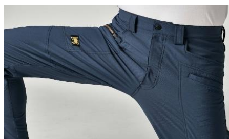
のびのびストレッチのジョガーパンツ