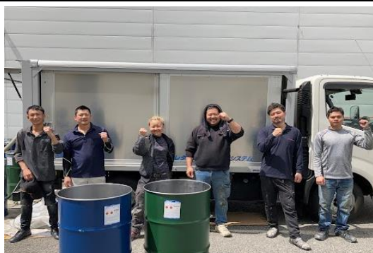
(有)スギヤマの皆様