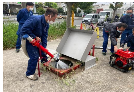
消防ポンプ準備OK(松田OP)

銀の汗43号案内の東京物流隣倉庫の消防点検が4/25日終了しました。熱・煙感知器・誘導灯と消火栓設備の点検を行い、消防ポンプ設備も実際に稼働して勢いよく水を排出しました。(昔は俺も、あれぐらい勢いがあった・・・松田OP)