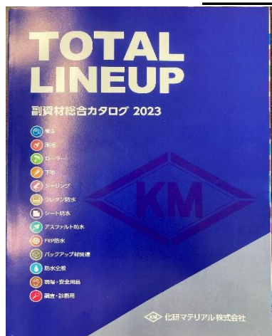
P140に及ぶ副資材カタログ2023