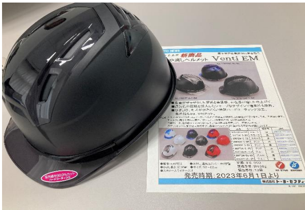
つや消しヘルメットVentil EM