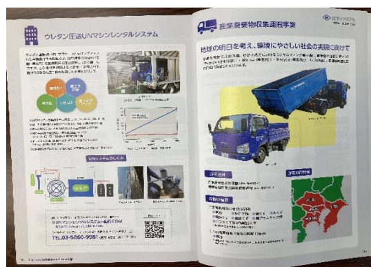
P132.133 UNマシン・産業廃棄物収集運搬

10年ぶりに刷新された、副資材カタログ2023には、UN・産廃・特販のコーナーがありコンパクトに内容を明示しています。今後は同カタログ内容をWEBで見れるように進めています。