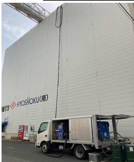
神戸市中央区の兵食7突冷蔵庫