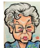
メリケン波止場の 灯がとる

久しぶりの関西！、今回の現場は兵庫県神戸市中央区海沿い小野小浜町にある冷蔵倉庫1,500㎡ UN8号機は、東京より520 km の道のりを、9時間かけて現場に向かいました。メリケンパーク近くの冷蔵倉庫は、施工もやり良い形の屋上でしたが、雨模様となり、結果宿泊が2日延長となりましたが無事に施工を終えることができました。後は、本場神戸のソウルフード、そばめしを、いただきます。