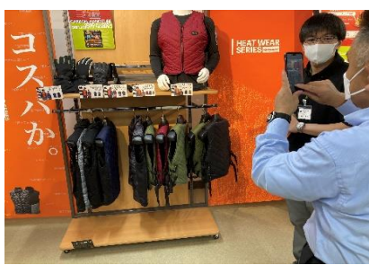
アタックベースにて