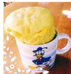
モコモコシフォン

廃液処理は、当社ドライバーが回収時にドラム缶の中に刷毛やローラーなどの異物が無いかフタを開けて確認します。蓋を開けたときに、反応する廃液を混ぜた場合は写真の様に熱を持ちモコモコと膨張する場合があります(混ぜるな危険)モコモコ部がゲル状の場合は廃液として回収可能ですが、固まりになった場合は廃液処理での回収は不可となり、別途廃プラスチック扱いの産廃ゴミとなりますので、何卒ご注意願います。