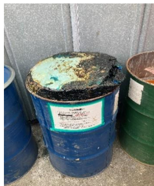
ドンドン膨らみこうなりました