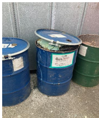
確認でフタを開けると