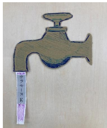
構想3年、製作30分 段ボール蛇口