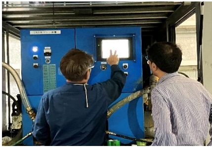
初のUNマシン操作パネル見学