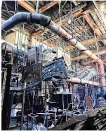
5月にリチウムイオン電池が原因とみられる火災で焼損した大田区の産業廃棄物処理施設

リチウムイオン電池が原因となっごみ処理施設や収集車での火災も増えている。発生要因としては、モバイルバッテリーが最も多く、加熱式たばこが続く。