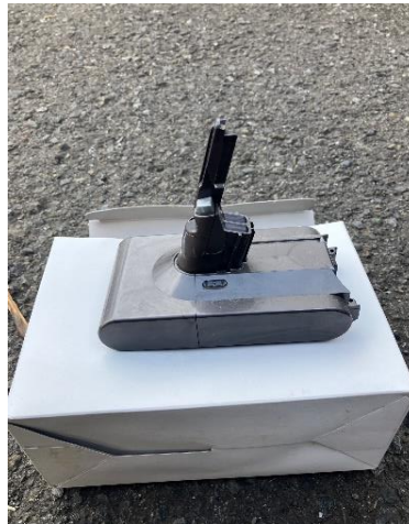
コードレスタイプ掃除機のリチウム電池

昨今、リチウム電池の発火による火災事故が発生していますが、産業廃棄物処分場もその影響で火災事故を起こした例が数件あり、リチウム電池は持込処分不可となっています。