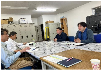
初の産廃ドライバーとの打合せ