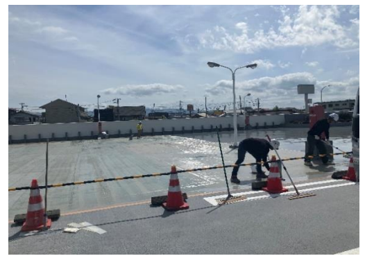
沼津市のコジマ電気屋上駐車場都合3,200㎡の内 急ぎA工区1,600㎡のAD-H30工法のUN施工