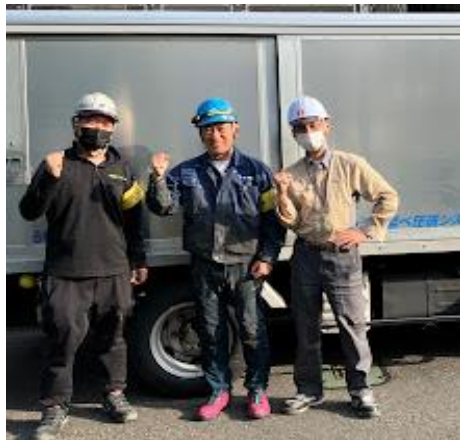
(株)ツーアール様と