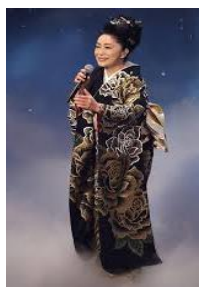
♪鷗見つめ泣いていました～

東日本大震災もコロナ禍も皆様方と乗り越えました。 今回も日本国が力を合わせて、乗り越えていける と確信しています。 必ず笑って話せる日が来ると！