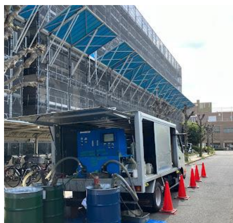
パークタウン若宮

埼玉県桶川市にある 5階建て 13棟 356戸からなる大規模マンションの 「パークタウン若宮」 UN施工は2025年の12月、その後1月・2月・3月 そしてこの度4月 合計現場に16回UNマシンを ご採用いただき。4月14日がラスト施工 無事にUN施工完了となりました。 4月の施工に関しては、中東問題で当初希釈材確保の 問題があり日程調整を行いました。