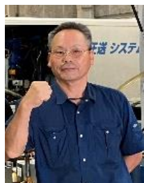
江縫オペレーター

2026年4月無事 定年退職 を迎え、20数年に及ぶUNマシンオペレーターとして活躍頂いた江縫オペレーターが、引退する運びとなりました。当社がまだ50億を目指そうと草創の息吹溢れる時代にドライバーとして約15年活躍。その後、新規事業開設したUNマシンオペレーターへと、白羽の矢が当たりました。最近では寄る年波に、夏の施工が体力的にもきつく感じていました。今後も、ウレタン圧送UNマシンの「全国制覇」に、陰ながら応援して参ります。今までご支援ありがとうございました。