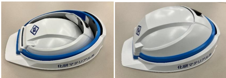
折りたたみヘルメットIZANO