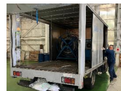
3号機廃車へマシン等降ろしました

UNマシン.COMサイトが立ちあがりました ブログ銀の汗にUNの活動状況一部掲載しています 銀の汗バックナンバーも掲載