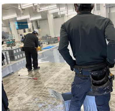
3階室内のウレタン防水:株式会社翔丸様