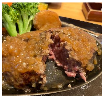
静岡で有名なハンバーグ店「さわやか」

豆腐の製造販売大手の、やまみ富士山麓工場3,700㎡のUN施工は、材料確保からスタートし施工日程調整をかけながら、なんとか5/11日に第1回目のUN施工サラセーヌEZ、7セットを圧送することが出来ました。時折雲のまにまに見える富士山に見守られながら広大な敷地、綺麗な空気、そこで先々製造される豆腐はさぞ美味しいだろうと思いました。