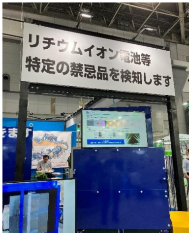
赤外線等で禁忌品検知