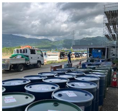
静岡県駿東郡のやまみ富士山麓工場