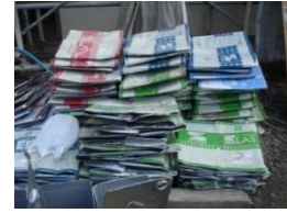
(荷揚げ・荷降ろしの最後は缶つぶしとなります)