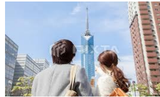
(あのビル俺が..ステキ)