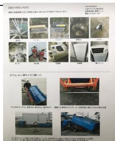
UNマシン.COMサイトの「産廃について」 産廃ドライバー達