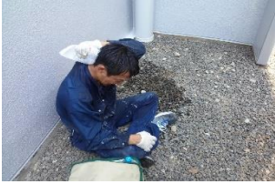
(さすがに夏の2,500㎡はオペレーターも施工後ぐったりです)

やっと入った若手職人も、従来工法ですと、いつまでも材料の荷揚げを行う作業中心で夏場は、荷揚げを終えると、もう体力消耗し体が動かなくなります。「何時までも、こんな事やってられない」と、現場を離れる若手職人も数多くいると聞いています。