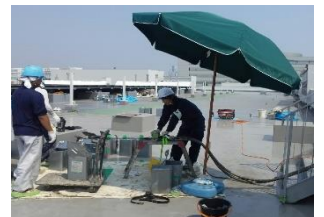
(パラソルで日陰を)

真夏の、屋上のお昼時は、照り返しもあり体感温度は軽く45度を超えています。 早く、クールダウンして明日の仕事に備えましょう。