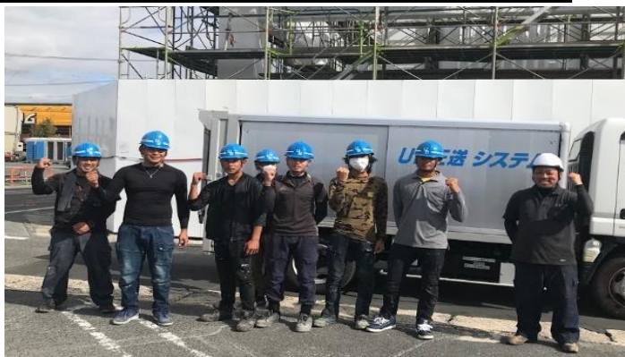
㈱ウエダ防水工業の皆様 右:化研G・NKマテリアル倉富OP