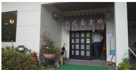
そばの名店くるまや様

元々狂ってたオペレーターも安心して ♪ 8時ちょうどの、UN4号で 私は私は、あなたから旅立ち一ますー と、信濃路を後にしました。Go To UN 全国の温泉宿UN現場大募集致しま-す！