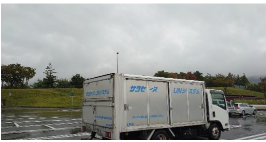
雨模様の為北アルプス連峰は雲の中

【くるまや蕎麦語録】 味を楽しむ人は、 一人前。 腹ごしらえの人は、 二人前。 蕎麦好きの人は、 大ざる。 蕎麦無しでは生きられない人 気狂いざる。