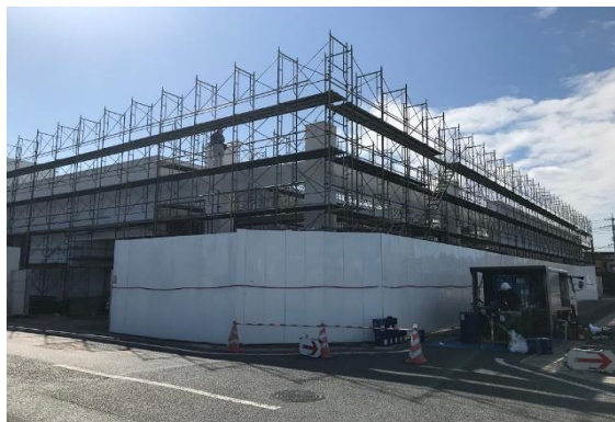
新築パチンコ屋さんの駐車場2,000㎡