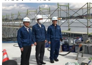
化研四国営業所から3名UN見学