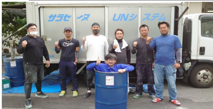
(株)スギヤマ防水の皆様

10月長野県安曇野市の温泉宿泊施設 屋上防水1,000㎡のUN施工がありました。 久しぶりの長野県でのUN施工。