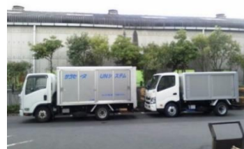
2.1Mの駐車場入り口(7号機可能)・2.2M以上(5・7号機可能)