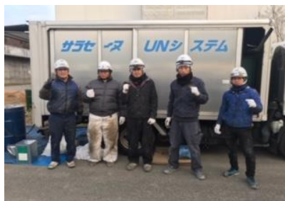
AZ施工を終えてバッチリの職人さん