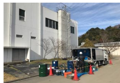
流山の排水処理施設