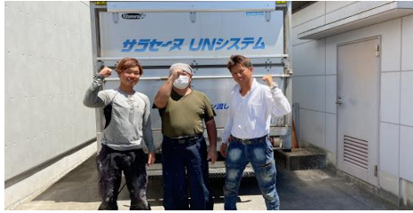
(有)サトー建工様(メゾンアルモニー:400㎡)