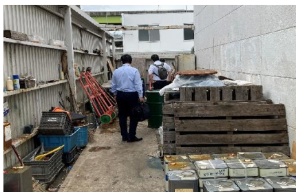
産廃チーム作業スペースの確認