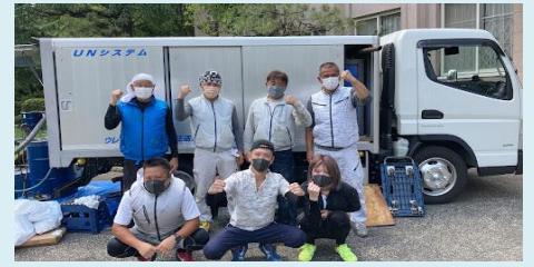
(株)北都レジ工業様