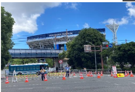
厳戒警備の横浜スタジアム

2020東京オリンピックが無事閉会し日本のメダルは記録的な金27・銀14・銅17個、計58個世界がパンデミックの中、日本でしか開催することができなかったであろう大会は、多くの感動を世界中に与える事が出来ました。電車で見かけた嬉々として動いていたボランティアの皆さん本当にお疲れさまでした。輝くメダルの影に裏方さんの銀の汗を感じた夏でした。引き続きのパラリンピックも全力応援致します。