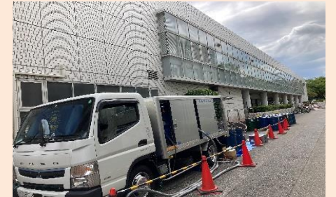
東京理科大学図書館2,300㎡

梅雨が明けた2021年8月、いきなり多くのUNマシン申込をUN専用サイトのWEB申込よりいただきました。