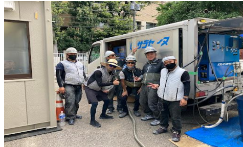
(株)スクード様(文京区立第三中学校:800㎡)