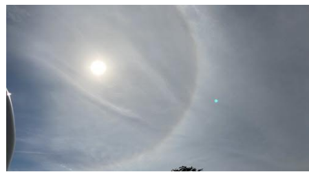
ハロ(日暈)がハローっと発生