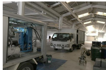
新木場第二倉庫UNメンテ車両見学